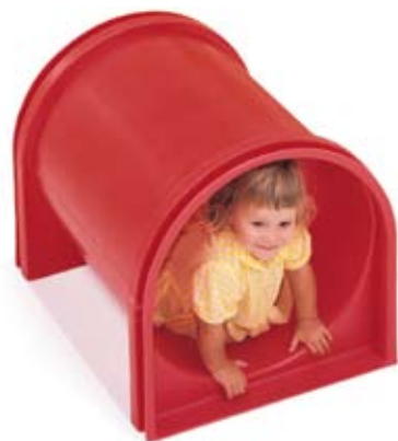
Rode Speelhuistunnel G752