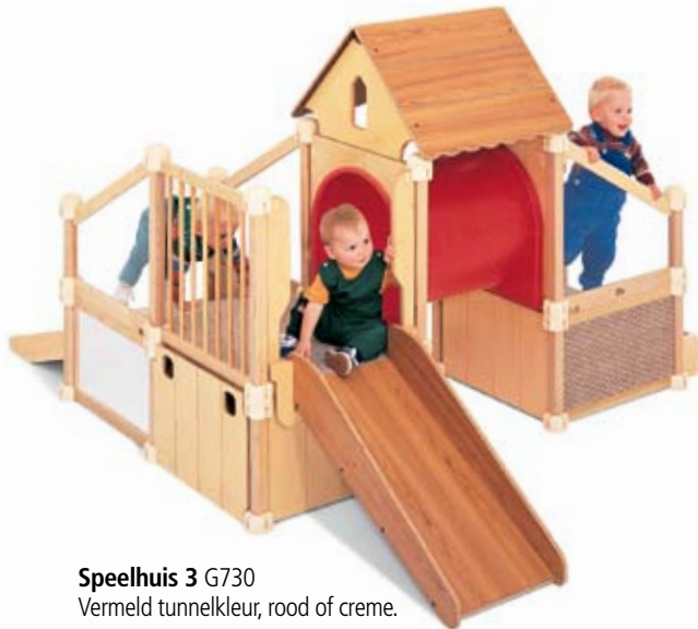
Speelhuis 3 G730

Deze compacte speelhuisjes bieden lichamelijke uitdagingen die geschikt zijn voor kinderen, zoals trappen, glijbanen en hellingen.